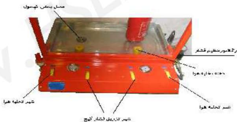
نمای تست هیدرو استاتیک از بالا

در قسمت تست در روی سینی دستگاه دو کپسول بطور همزمان و یا تک تک امکان تست را دارد فشار آب در این دستگاه از صفر تا ۲۷ قابل تنظیم است در صورت ترکیدن کپسول درحین تست هیچگونه پرتاب و یا عکس العملی ایجاد نمی شود در قسمت بشکه ترکاندن کپسول این امکان وجود دارد تا فشار را از صفر تا 100 بار متناوباً بالا برد و با دقت مراحل مقاومت بدنه از دفرمه شدن تا ترکیدن را مشاهده نمود بدون خطر.